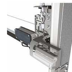
seguro de cable