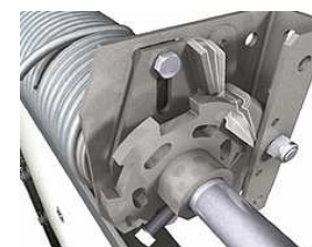
seguro de muelles